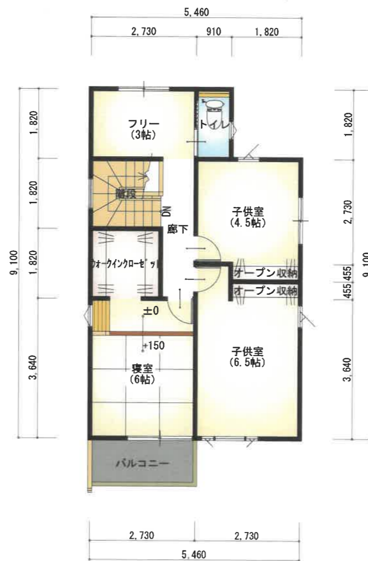
2階 平面図 S:1/100