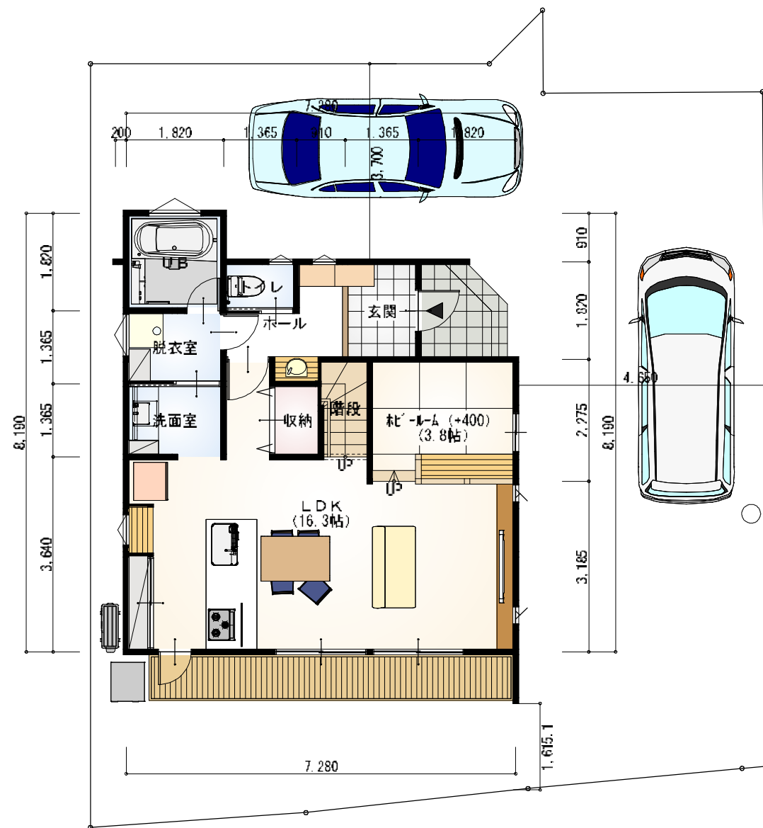
1階 平面図 S:1/100