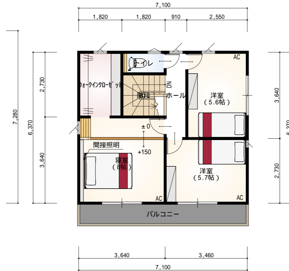
2階 平面図 S:1/100